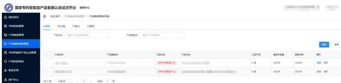
图 6 产品备案信息更新列表页

2023 年及以前备案通过的产品，须进行已备案产品信息更新，未进行备案信息更新的往年产品，不能参与本年度专利密集型产品认定工作。单位点击“产品备案信息更新”菜单，进入产品数据更新页面，在“未更新”下，单位需更新已备案产品新一年的经营数据，并确认该产品信息和关联专利信息是否发生变化，根据实际情况进行修改和更新，提交等待系统审核。试点平台系统对备案产品更新信息进行形式校验，若更新未通过，则单位需重新修改产品信息再次提交审核。